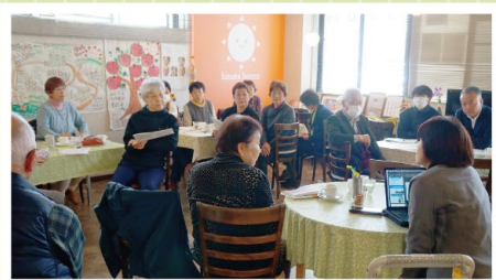
研修に参加した「いいせ」の会員